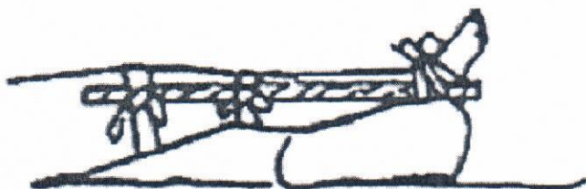
Рис. 3. Наложение шин при переломе костей голени

При переломе черепа пострадавшего уложить на носилки таким образом, чтобы голова была несколько приподнята, по бокам ее уложить два валика. На голову положить холод.