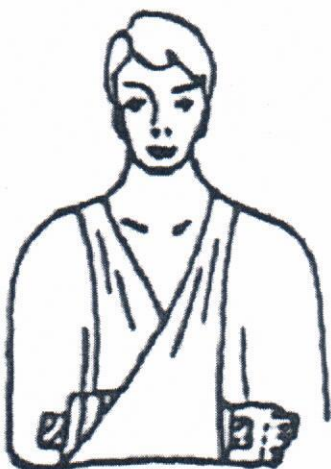
Рис. 2. Положение шин при переломе костей предплечья

Шины накладывают таким образом, чтобы они захватывали не менее двух суставов, между которыми находится перелом. Под шины нужно подложить мягкий материал - вату, полотенце и пр. (Рис. 2 и 3).